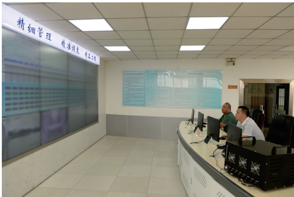
6月16日，在蚌埠闸工程管理处控制室内，两名工作人员查看计算机监控系统。