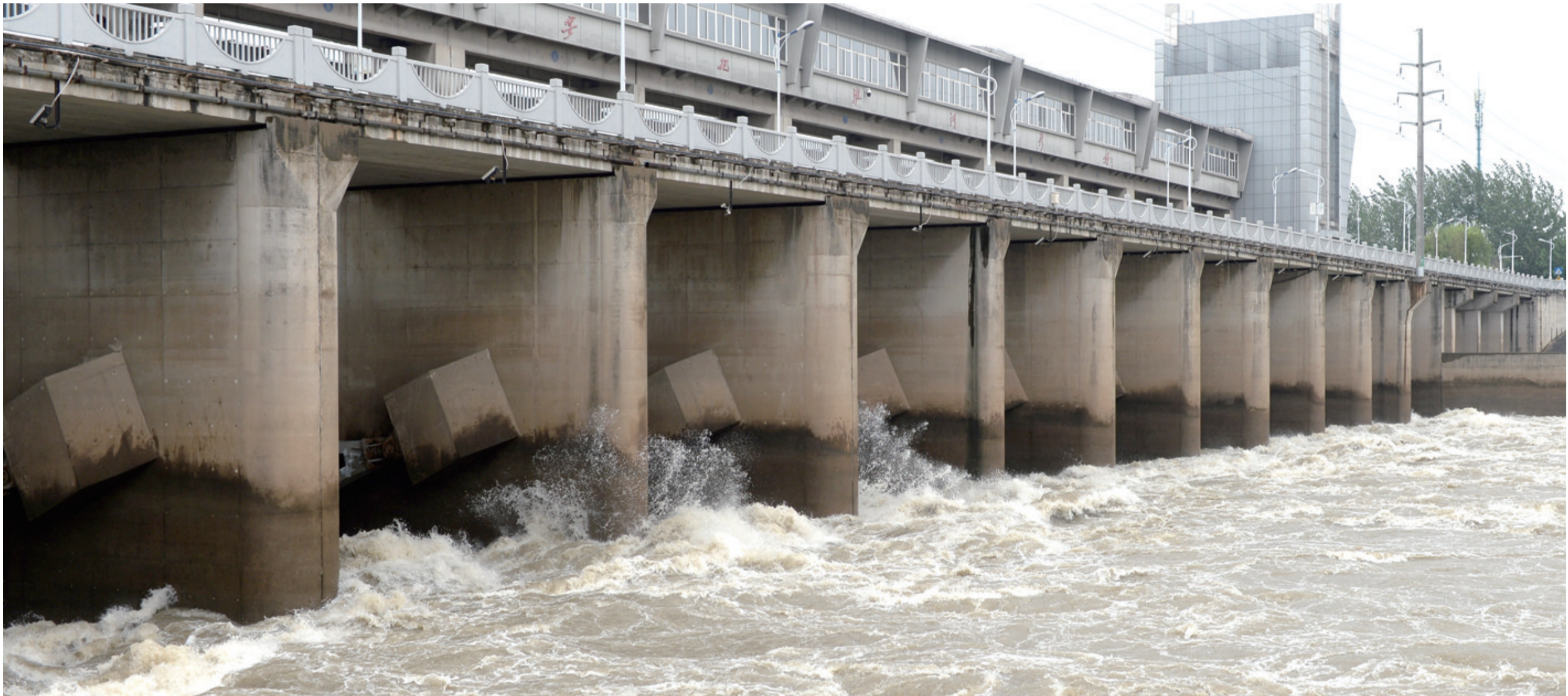
这是6月16日拍摄的蚌埠闸。