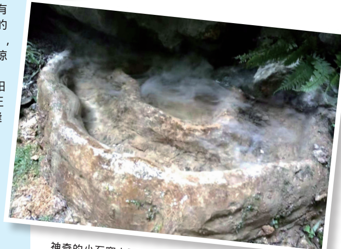
神奇的小石窝上面冒着丝丝水雾