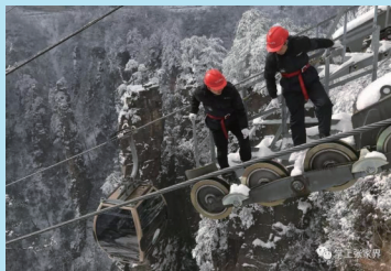
► 天子山索道工作人员冒着冰雪在索道支架上巡检。