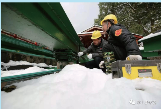
十里画廊观光电车工作人员在检查电车钢轨运行情况