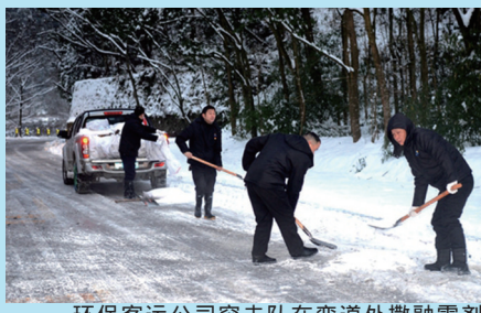
环保客运公司突击队在弯道处撒融雪剂防止路面结冰。