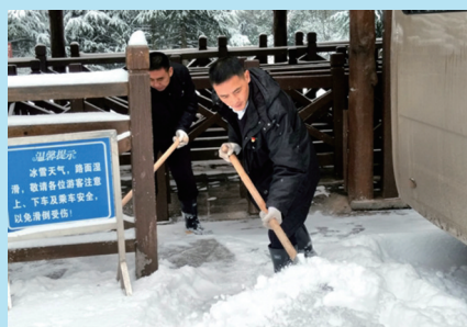
环保客运公司党员们在天下第一桥站场除雪。