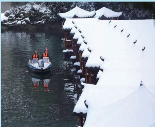
宝峰湖景区工作人员乘快艇对游船进行巡检。

元旦期间，一场大雪铺天盖地而来，整个城市都素装银裹。为了确保游客安全、舒适欣赏这场绝美冬景，有一群人奋勇冲在前线，抗冰雪，保畅通，周身散发出一股暖流，汇聚成雪中别样的景致。他们是环保客运公司扫雪保道路畅通的突击队队员，是冒雪检查设备的十里画廊观光电车工作人员，是迎风巡检游船的宝峰湖工作人员，是高空检查索道的天子山索道工作人员，是为游客解难答疑的黄龙洞景区工作人员。让我们跟着镜头，慢慢感受这股雪中暖流。