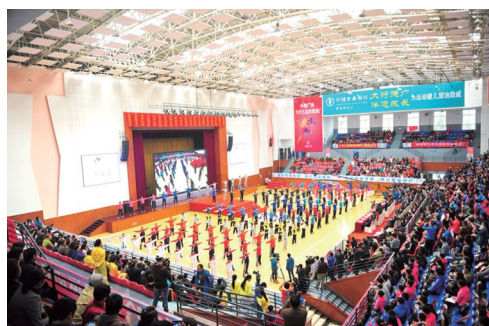
张家界市第五届运动会开幕式现场。资料图

精彩纷呈、特色鲜明的赛事活动，在扩大张家界对外影响力的同时，也彰显了张家界全力推进体育旅游融合发展的自身优势和魄力。近几年来，市文体广电新闻出版局依托各类体育赛事和活动带动20万余人参与，产值达十亿元，实现了扩大城市影响与丰富群众生活“双赢”。