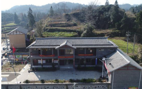
新修的烽火村村部。