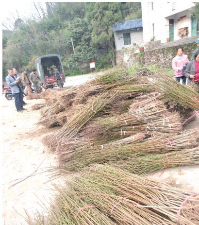
三台山村村民准备栽种黄桃苗。