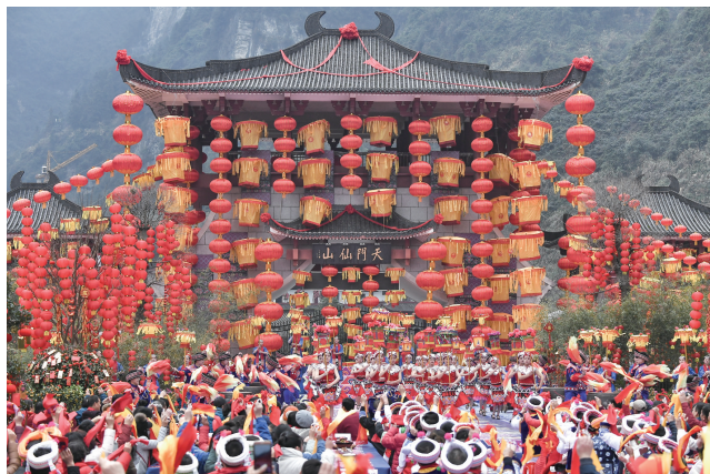
东西南北贺新春活动现场。

润心无声逐梦行，万紫千红满园春。新思想引领新时代，新征程澎湃新力量。立足新起点，永定区将在党的十九大精神和习近平新时代中国特色社会主义思想指引下，积极探索宣传、旅游和文化联姻的新路径，以国际化的视野，在新时代，有新作为，谱写新的壮丽篇章，为永定区实施 旅游带动 绿色崛起 发展战略，助推经济社会全面协调发展作出新的更大贡献。