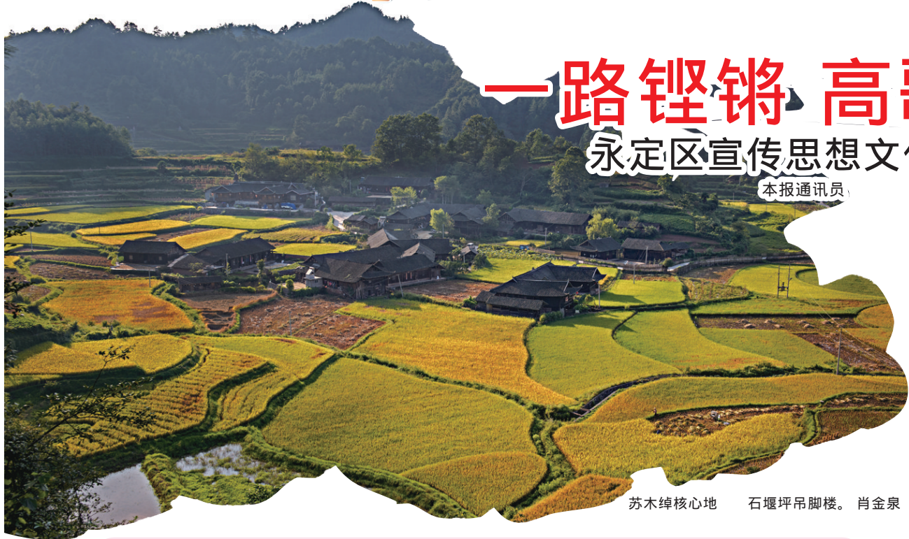
苏木绰核心地 石堰坪吊脚楼。